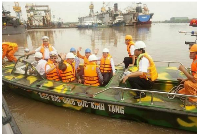
Đại biểu Kiều bào Đức tham gia chạy thử xuồng cao tốc CQ trước khi bàn giao cho Hải quân Việt Nam.

Với việc đề ra những dự án ngắn hạn và 5 năm, “Quỹ vì chủ quyền biển đảo Việt Nam” sẽ tập trung vào việc hỗ trợ nhà ở, sách vở và trao học bổng cho các cháu học sinh, sinh viên đại học, cao đẳng tại thành phố Hồ Chí Minh là con em của các gia đình cán bộ, chiến sĩ đang làm nhiệm vụ tại quần đảo Trường Sa (mô hình phát triển theo dự án tại Hà Nội của kiều bào Đức như đã nói ở trên).