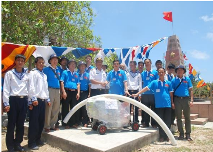
Đoàn đại biểu DUNN tặng máy bơm nước mặn cho đảo Song Tử Tây 4/2015.

Những ngày cuối tháng 4/2015, chúng tôi được Đảng ủy Ngoại nước chọn tham gia Đoàn Công tác 06 đi thăm, động viên cán bộ, chiến sĩ và nhân dân quần đảo Trường Sa. Trên chuyến tàu HQ561, 14 đại biểu đến từ 9 nước (Úc, Mỹ, Hàn Quốc, Pháp, Đức, Ba Lan, Ăng-gô-la, Nga và Séc) của đoàn Đảng ủy Ngoại nước được phân công sinh hoạt tại phòng D7. “Đơn vị” chúng tôi ra đời từ đó.