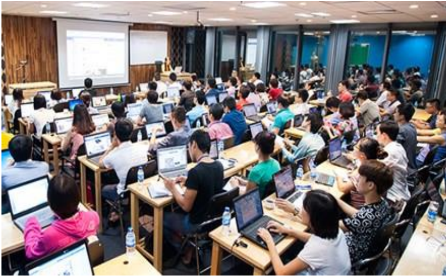
Lớp học Marketing trên mạng xã hội thu hút đông học viên.

Ngoài ra, Facebook còn là một “trung tâm giao tiếp” vô cùng tiện lợi. Học trò có thể gửi lời tâm sự đến thầy cô hầu như bất cứ lúc nào. Khi có thời gian, thầy cô cũng có thể vào xem và trả lời các câu hỏi ấy, gửi những tâm tình đến học sinh một cách tự nhiên thông qua những comment (bình luận) liên tục, thường xuyên... Biết khai thác mặt tích cực, Facebook có thể trở thành một “người thầy tâm giao” của rất nhiều bạn trẻ.